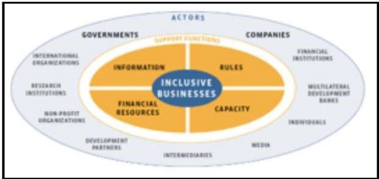
Gambar 2: Inclusive Business Ecosystem