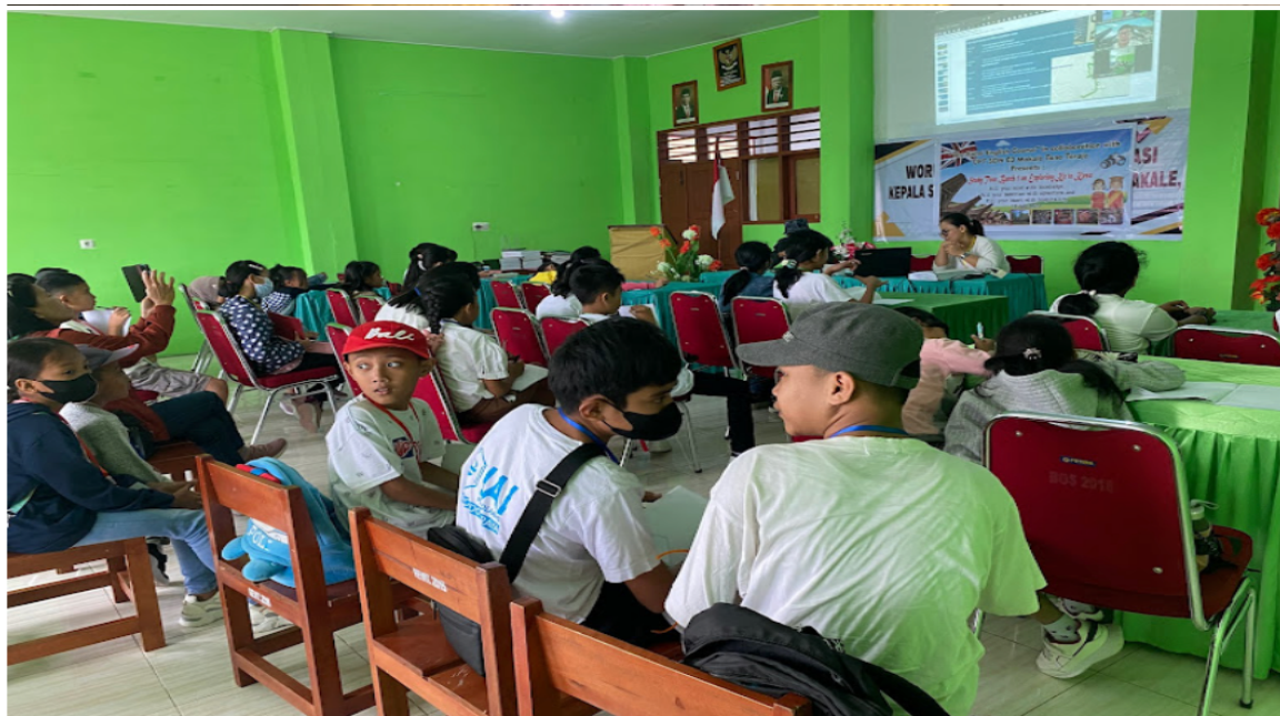
Gambar 3. Peserta pelatihan penggunaan Bahasa Inggris